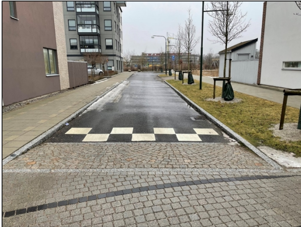
Figur 2 Bild på Höbalsgatan

infarter eller platsbildningen för att kunna mötas. Det finns inte några separata cykelbanor, utan cykling sker i körbanan. Ett syfte med de smala körbanorna och förskjutningarna mitt på sträckan är att dämpa bilarnas hastighet.