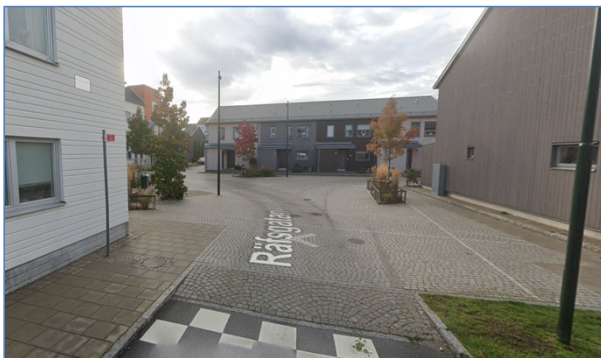
Figur 3 Bild på platsbildningen på Räfsgratan

Systerbrunnsvägens körbana är också smal, ca 4 m, med en separerad gång- och cykelbana längs den södra sidan. Sträckan mellan Sadesfältsgatan och Elinelundsvägen är ca 180 m lång. Mitt på sträckan finns det en mötesplats. På den södra sidan av Systerbrunnsvägen ligger koloniområdet Elinelunds sommarstad. På den norra sidan ligger bland annat Hyllie Park grundskola.